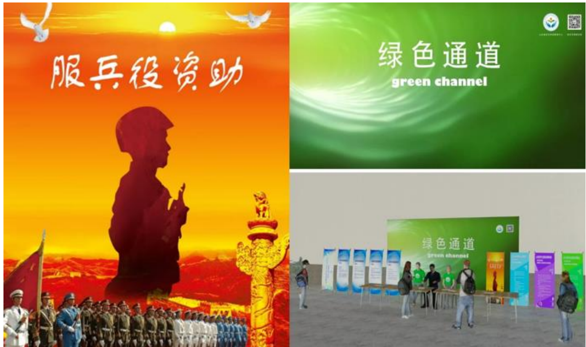
图 6. 我厅印制海报解读学生资助政策