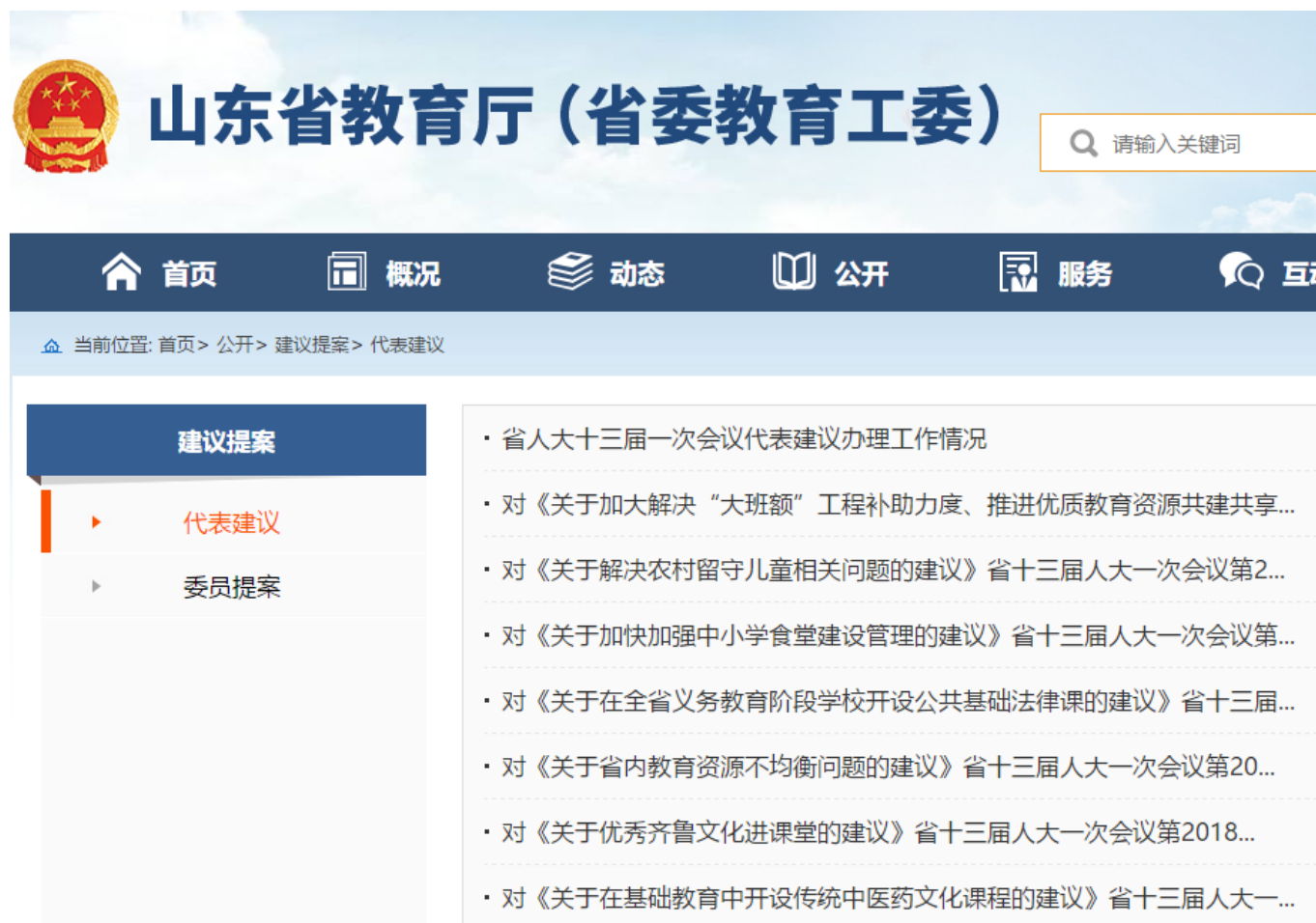
图9. 我厅网站开设专栏公开建议提案办理复文

2018年，我厅承办的人大代表建议和政协委员提案复文首次在厅门户网站开设专栏向社会公开。