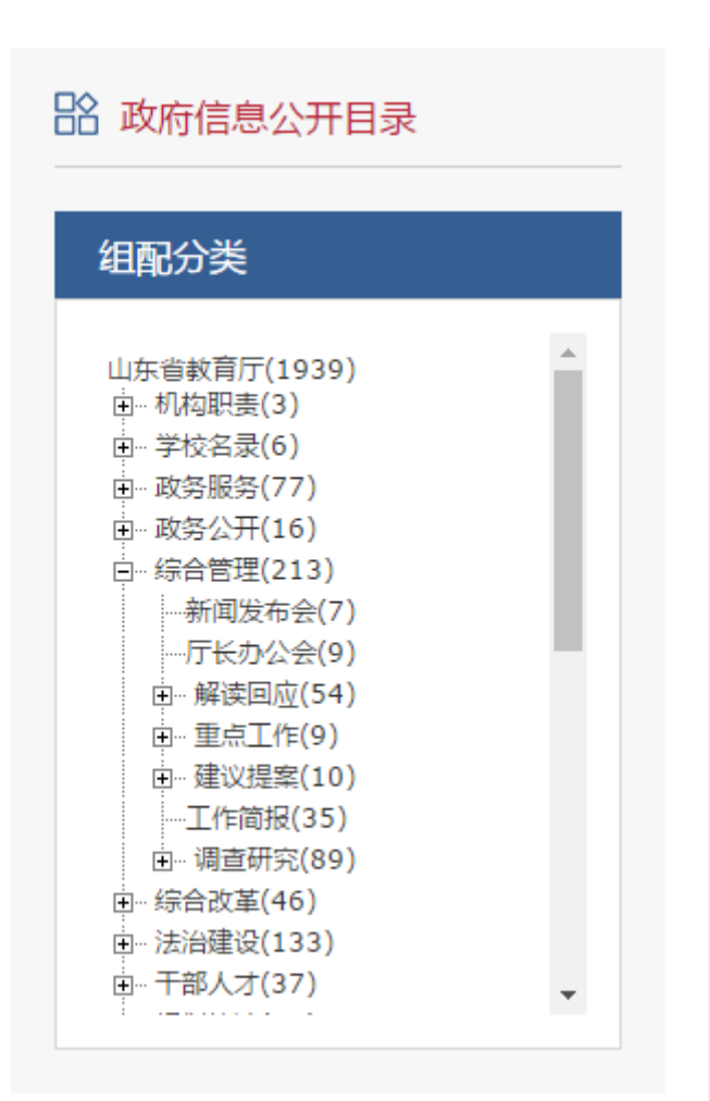
图 1. 我厅门户网站发布的主动公开基本目录