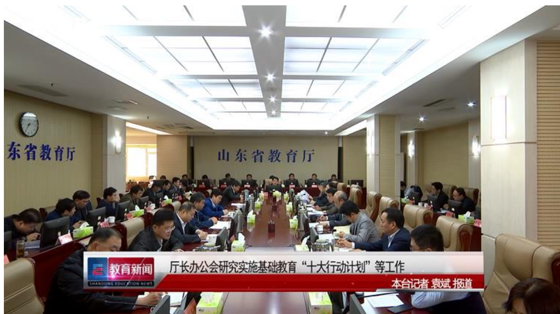
图2. 山东教育卫视的《教育新闻》报道第14次厅长办公会

2018年10月，我厅在修订《政务公开工作规则》时，将厅长办公会公开制度正式列入了工作规则，对邀请相关人士列席和新闻媒体报道等作出了明确要求。