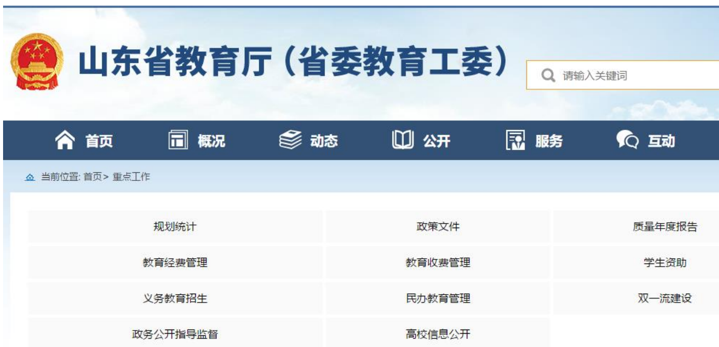
图 8. 我厅网站开设的信息公开重点工作专栏

我厅认真落实国务院办公厅和省政府办公厅对社会公益事业建设领域政府信息公开的要求，在我厅门户网站开设专栏公开政策文件、发展规划、经费分配、经费使用管理、收费管理、学生资助、各级各类教育、民办非学历高等教育机构资质管理、民办教育质量管理等信息。