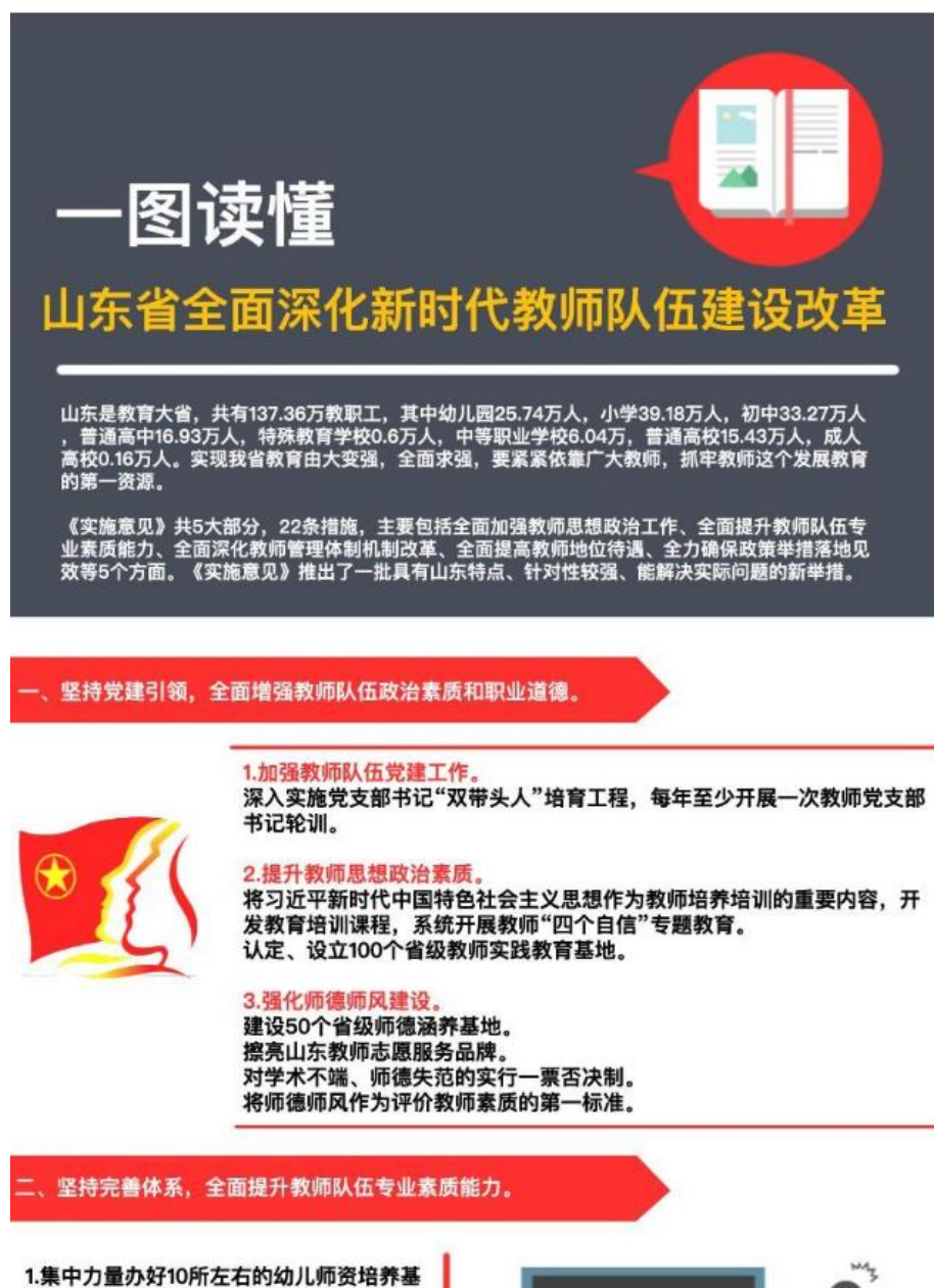
图 5. 我厅通过新媒体解读全面深化新时代教师队伍建设政策